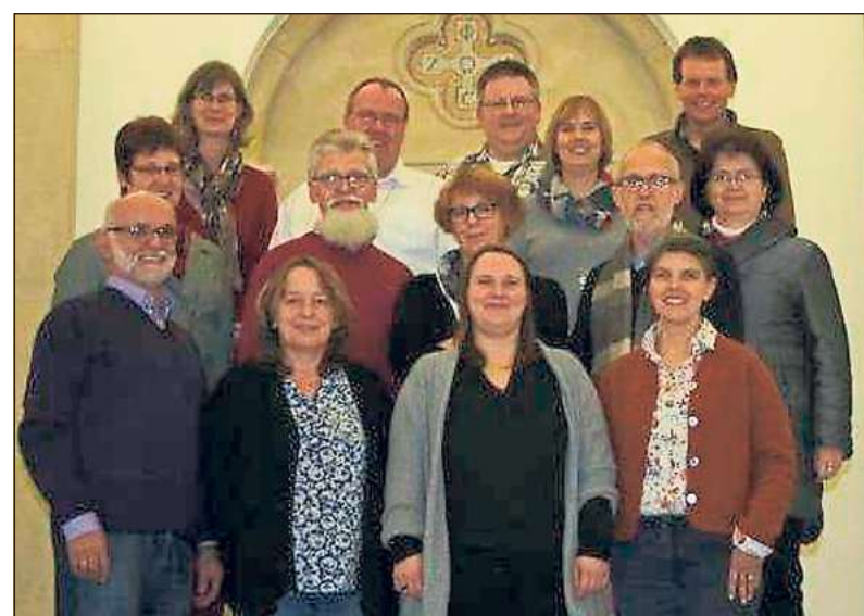
Die Mitglieder des Pfarreirates beschäftigten sich bei einer Tagung mit den liturgischen Angeboten.