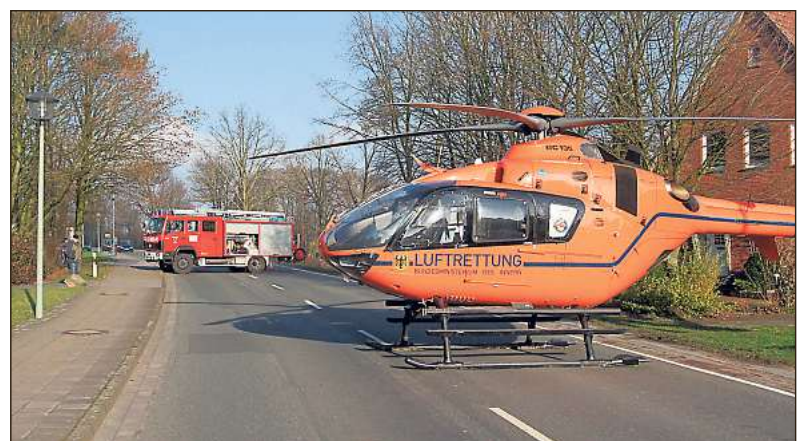
Am Friedhof landete am Samstag ein Rettungshubschrauber. Mit ihm wurde ein verletzter Mann in eine Klinik nach Bielefeld gebracht. Die Straße musste für die Landung gesperrt werden.

ge den Unfallort wieder verlassen. Die Greffener Straße musste für die Hubschrauberlandung um etwa 13.30 Uhr komplett gesperrt werden. Die Sicherung übernahmen Kräfte der Freiwilligen Feuerwehr. Der verletzte Mann wurde in eine Klinik nach Bielefeld gebracht.