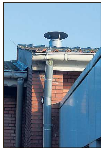
Gerade am ältesten Gebäudeteil der jetzigen Grundschule gibt es Sanierungsbedarf.