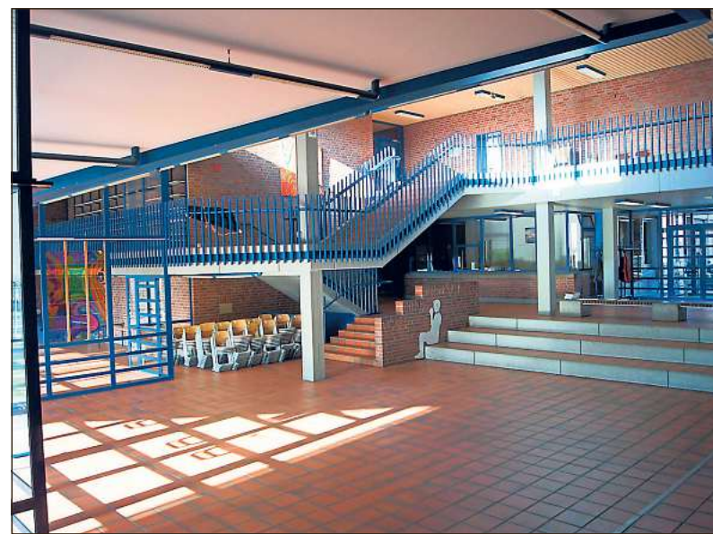
Das Foyer des ehemaligen Hauptschulgebäudes soll erhalten bleiben – auch für außerschulische Zwecke.